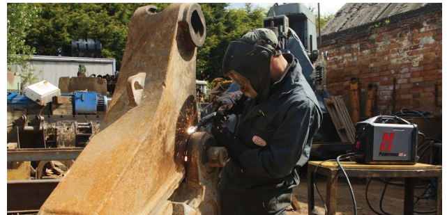
Serwis i naprawa